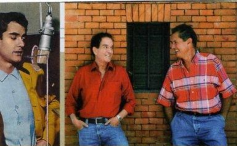
Distintos momentos de la vida profesional y artística del Dúo Dinámico, desde sus comienzos en Barcelona o sus incursiones en el cine con Marisol.

con mayúsculas, como El Quijote , que debe estar libre en la Red. Ahora bien, quien dice que una película es cultura está equivocado. Una película como Torrente , a pesar de ni admiración a Santiago Segura , no es cultura en sí. Como una canción de Lady Gaga . Eso es ocio. Y si hablamos de ocio, pagas por ello sí o sí, porque detrás de, por ejemplo, nuestro disco, hay cantantes, músicos, productores, gente que hace la promoción, transporte, secretarías... hay mucha gente. Hay de todo. Y hasta que no lleguemos a entender el problema no lo solucionaremos. También es cierto que no se ha sabido explicar. La primera, la SGAE, que es la que peor lo ha explicado.